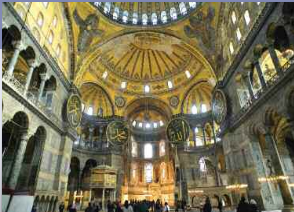
La Basilique Sainte-Sophie, Istanbul

Pomme. Retour à l'hôtel pour le déjeuner. L'après-midi visite d'une des villes souterraines de la région, refuge des populations locales en périodes d'invasions et véritable labyrinthe aménagé sur plusieurs étages. Pour terminer coucher de soleil sur une terrasse au milieu des vignes face à l'impressionnant paysage de la vallée. Dîner et logement à l'hôtel ( possibilité de soirée folklorique dans un restaurant troglodytique: 40 € ).